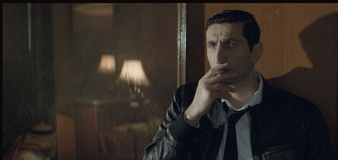
FARES FARES | NOREDIN

Fares Fares è un attore svedese nato nel 1973 a Beirut. Nel 2000 interpreta la commedia di culto di Josef Fares Jalla! Jalla! e si fa conoscere a livello internazionale. Nel 2012 ha il primo ruolo in un film americano, Safe house – Nessuno è al sicuro di Daniel Espinosa, accanto a Denzel Washington. Nello stesso anno è nel cast del film candidato all'Oscar Zero dark thirty diretto da Kathryn Bigelow. Tra i lavori più recenti di Fares ci sono la serie tv drammatica della Fox Tyrant (2014-2016) e i lungometraggi Child 44 – Il bambino N. 44 di Daniel Espinosa (2015), La comune di Thomas Vinterberg (2016) e Rogue One: A Star Wars Story di Gareth Edwards (2016).